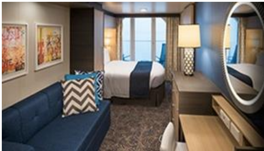
Ocean View with Balcony ห้องพักมีระเบียงวิวทะเล ขนาดห้องพัก : 198 ตารางฟุต ขนาดระเบียง: 55 ตารางฟุต

รายการท่องเที่ยวอาจเปลี่ยนแปลงหรือสลับกันได้ตามความเหมาะสม ทั้งนี้ถือเป็นเอกสิทธิ์ของผู้จัดโดยยึดถือตามสถานการณ์และประโยชน์ของท่านเป็นสำคัญ